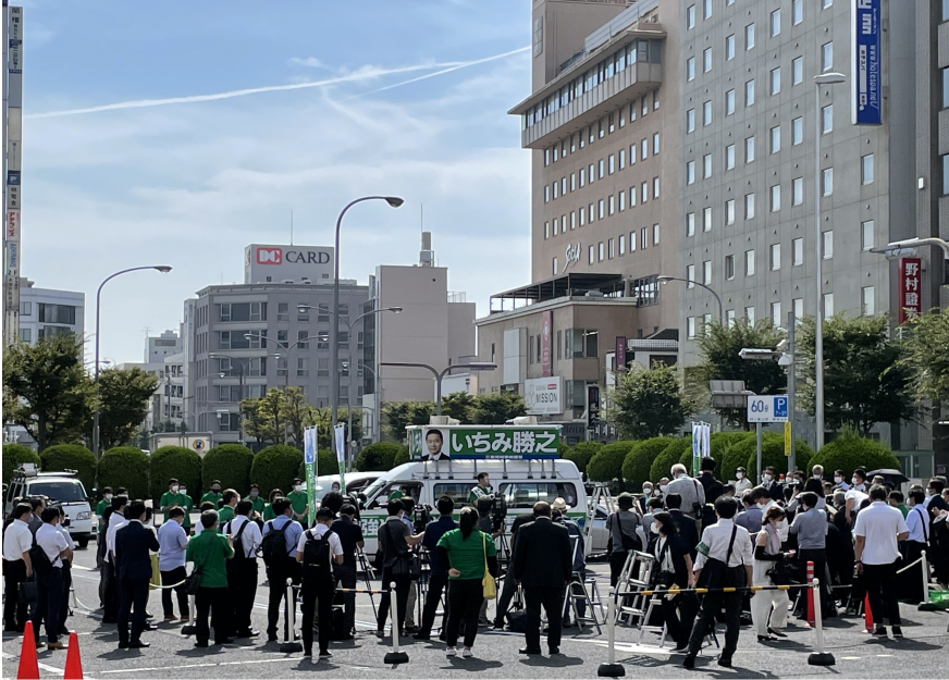
三重県知事選挙 津駅前ロータリーで出陣式を行う一見勝之候補者

各市町に於いても行政書士制度に理解のある地方議会議員を応援してまいりますのでご協力のほどよろしくお願いたします。